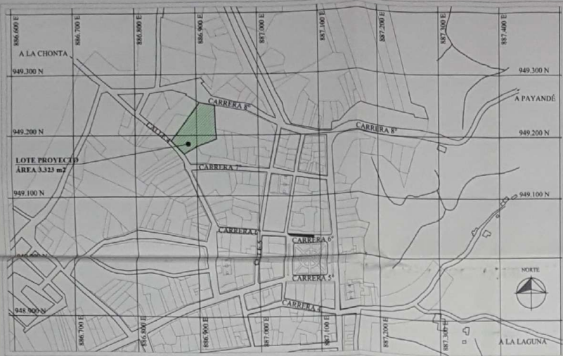
LOCALIZACIÓN GENERAL ESC. 1:4,000