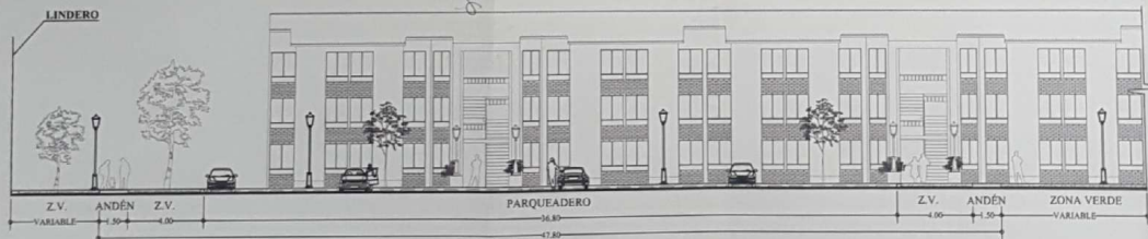
SECCIÓN A-A ESC. 1:200